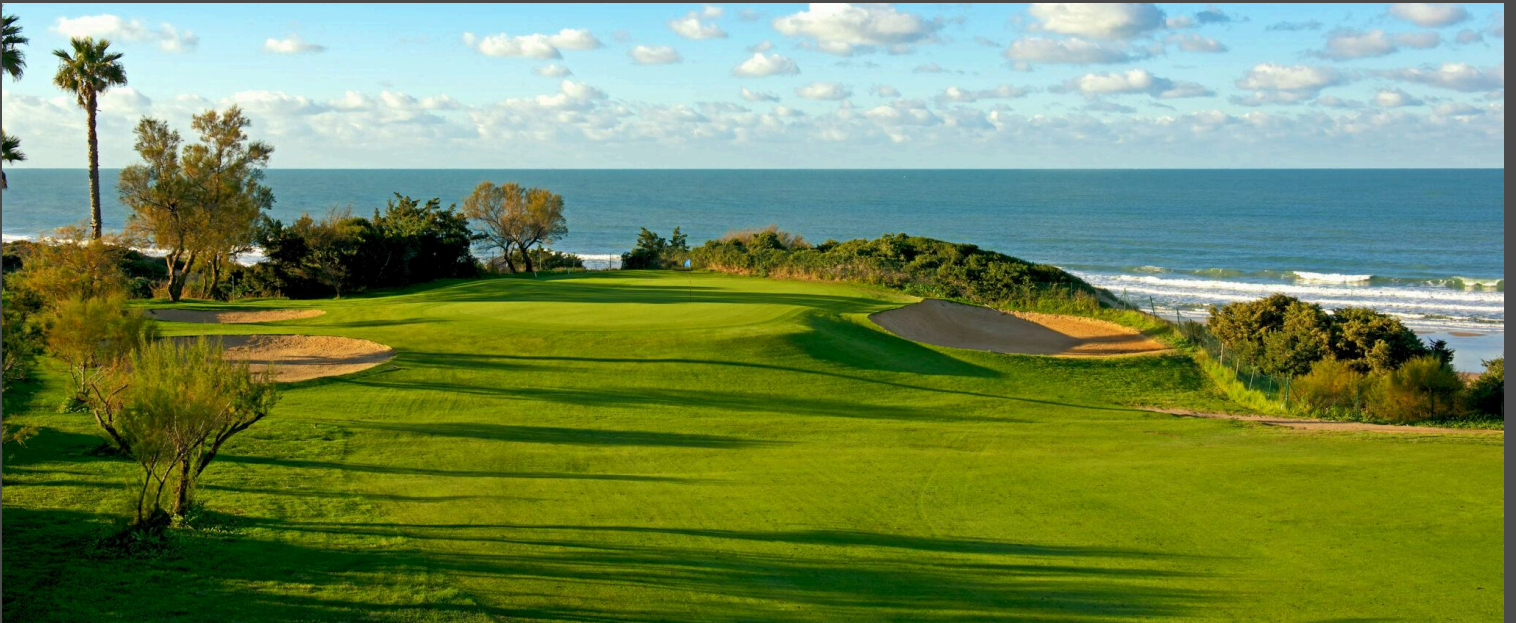
Novo Sancti Petri B