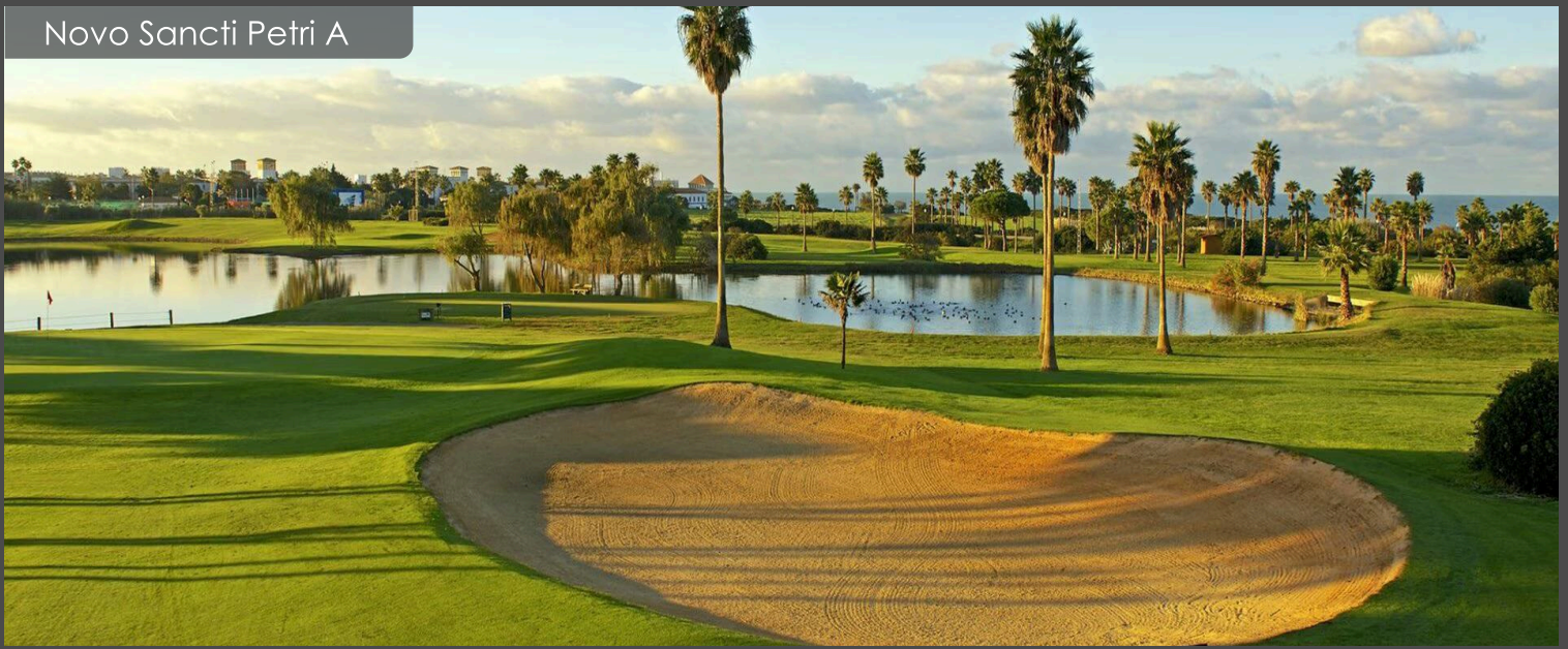
Novo Sancti Petri A